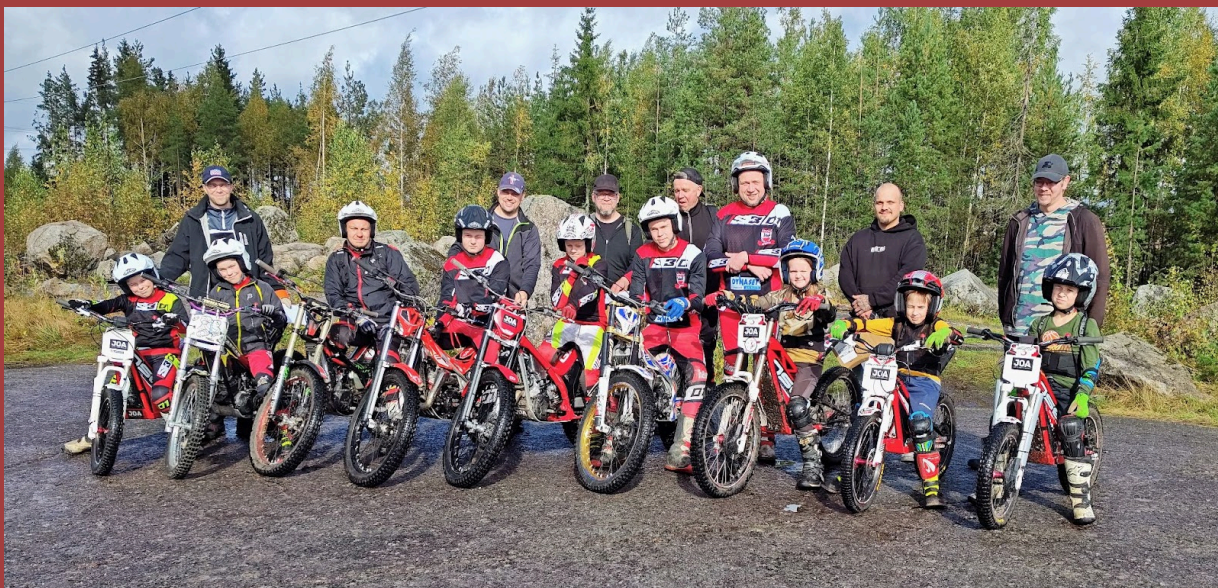
Yhteiskuva vuoden 2025 Sulka-trial osallistujista.